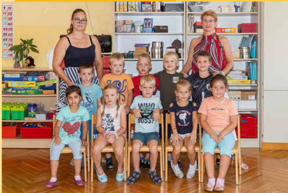
Osnovna šola Vojnik, Podružnična osnovna šola Šmartno v Rožni dolini, 1. razred