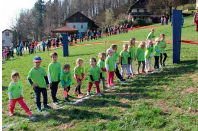
Naši najmlajši tekači