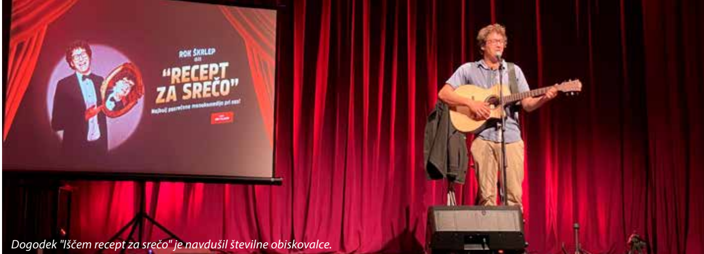
Dogodek "Iščem recept za srečo" je navdušil številne obiskovalce.

V nedeljo, 8. septembra, smo v Kulturnem domu Vojnik pripravili nedeljsko kino matinejo za družine. Ob ogledu dokumentarnega filma "Divja Slovenija" v režiji Mateja Vranice in njegove ekipe smo uživali v čudovitih kadrih, ki so osvetlili naravne lepote slovenske pokrajine. Film "Divja Slovenija" predstavlja izjemno pestro favno in floro Slovenije s poudarkom na sesalcih in pticah ter vključuje tudi zanimive vrste dvoživk, rib, žuželk in rastlin.