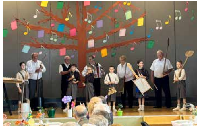
Vrajeva peč s podmladkom

Udeleženci srečanja so z zanimanjem spremljali kulturni program.