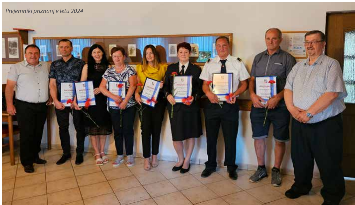
Prejemniki priznanj v letu 2024

Med vsakoletne dogodke ob praznovanju krajevnega praznika Nove Cerkev sodi tudi proslava v spomin na padle borce pri spominskem obeležju v Novi Cerkvi. Z