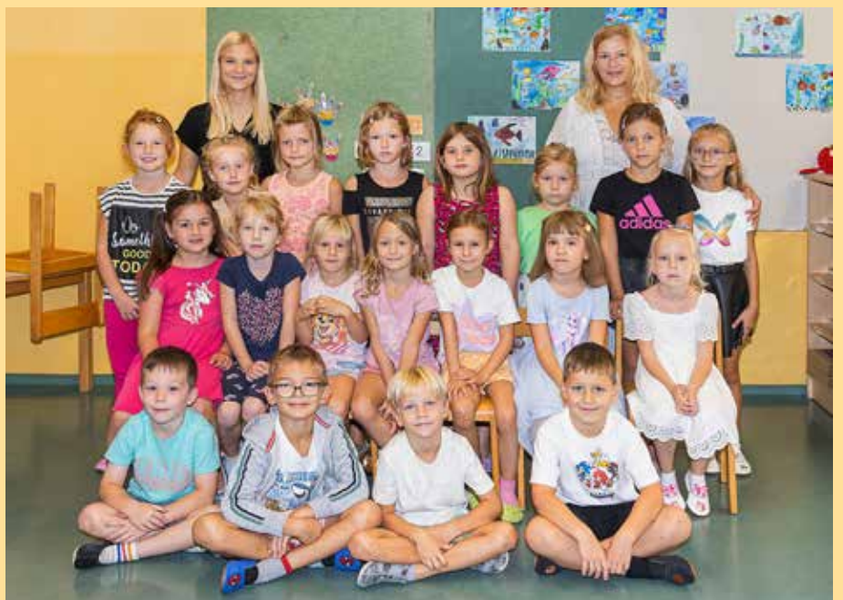
Osnovna šola Vojnik, 1. b razred