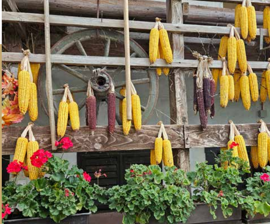
Jesenska okrasitev gospodarskega poslopja v Socki.