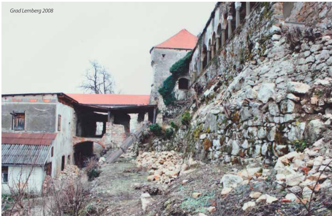
Grad Lemberg 2008

Akustičnega tria Goran Bojčevski med postaja prijetno prizorišče kulturnih zidovi nekdanje grajske žitnice, ki dogodkov pod zvezdami.