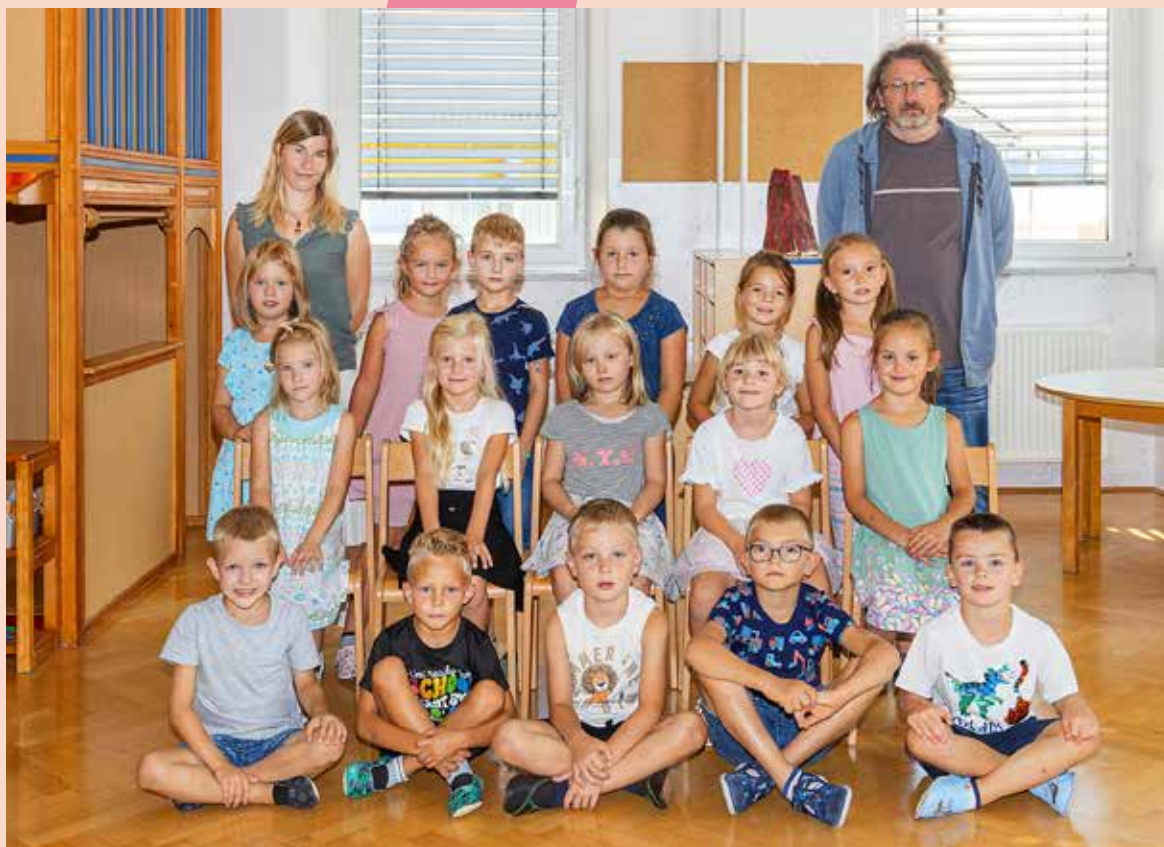
OŠ Anton Bezenšek Frankolovo, 1. razred