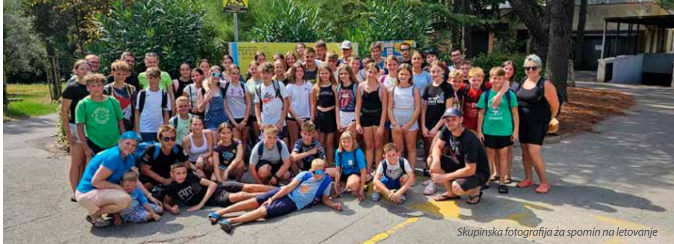
Skupinska fotografija za spomin na letovanje