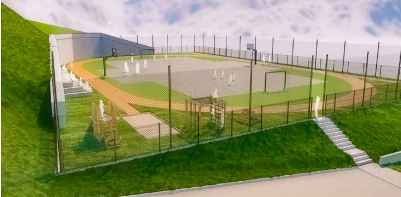
Načrtovano igrišče na Frankolovem bo vključevalo več funkcionalnih površin.

Zavedamo se, da bodo gradbena dela vplivala na dostop do vrtca, zato se staršem opravičujemo za morebitne nevedčnosti. Še posebej hvala za vašo strpnost in razumevanje v času gradnje. Verjamemo, da bo končni rezultat vreden začasnih prilagoditev, saj bo novo športno igrišče vsem nam prineslo veliko pozitivnih sprememb.