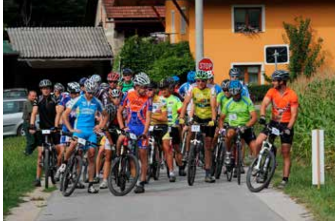
Udeleženci vzpona na Strnadov travnik nestrpno čakajo na štart