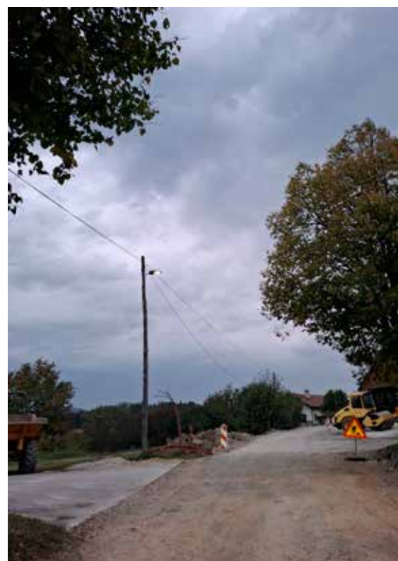
Rekonstrukcija ceste Razgor-Bovše

Ob koncu poletja, ko se otroci vračajo v šolske klopi, vse voznike prijazno