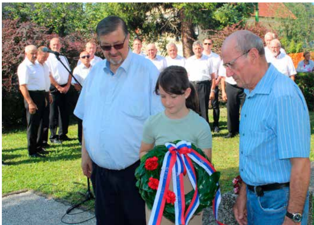
Poklon žrtvam druge svetovne vojne pred spomenikom NOB

V okviru krajevnega praznika je KORK Nova Cerkev skupaj s KS Nova Cerkev pripravil srečanje starejših krajanov nad 80 let. Letos smo se družili 6. julija. Srečanje je bilo pod šotorom pred gasilskim domom Nova Cerkev. Hvala vsem in upamo, da se prihodnje leto zopet vidimo.