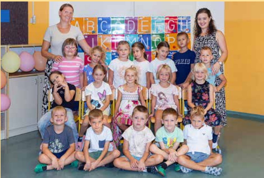
Osnovna šola Vojnik, 1. a razred