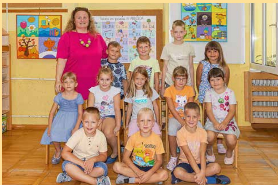
Osnovna šola Vojnik, Podružnična osnovna šola Nova Cerkev, 1. razred