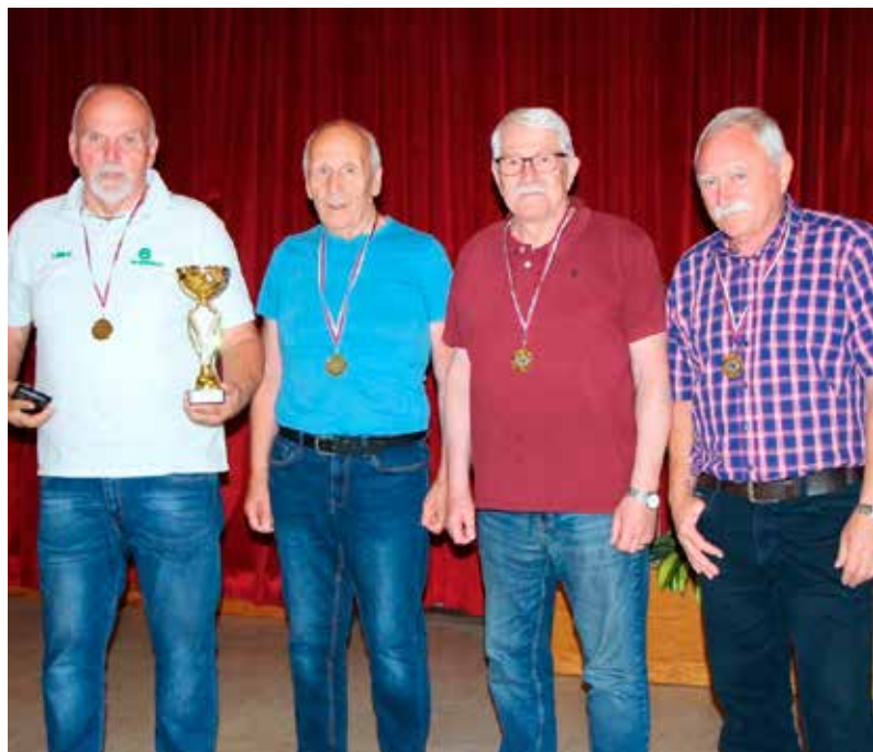
Osvojeno 1. mesto ekipno za strelce Strelske sekcije Društva upokojencev Vojnik na Dobrni.

pokale za 1. mesto ekipno, in sicer v Dobrni, Vojniku, Vitanju in na Ostrožnem. Pa tudi posameznih uspehov ne manjka. Upajmo, da se bomo še kar nekaj časa dobivali ob prijetnem druženju in seveda v tekmovalnem duhu.