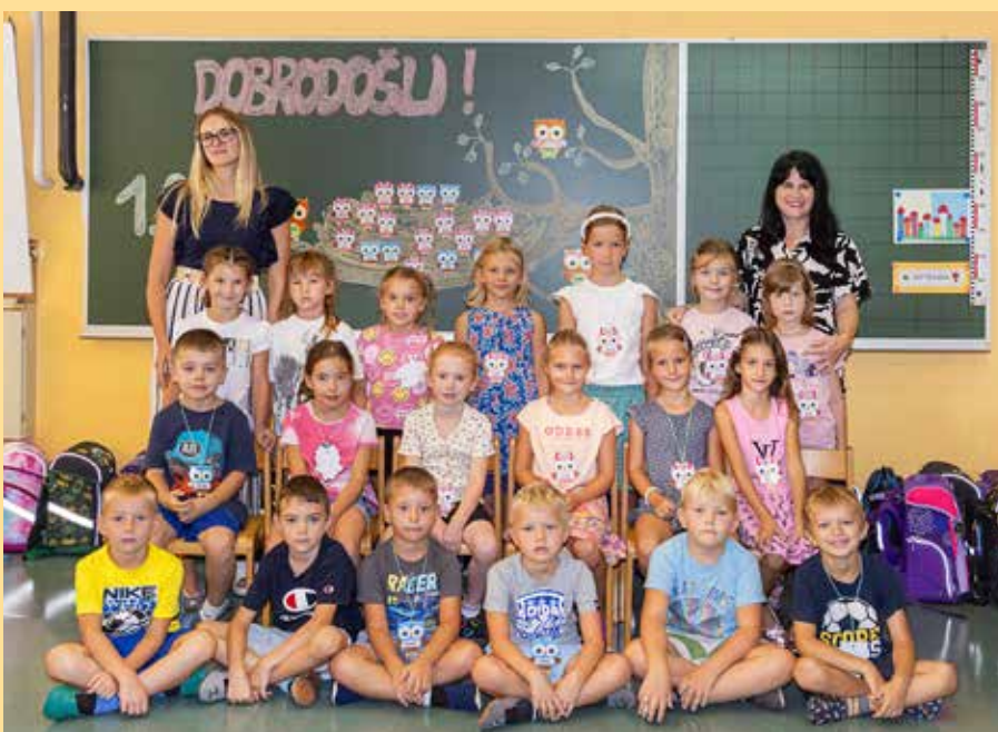
Osnovna šola Vojnik, 1. c razred