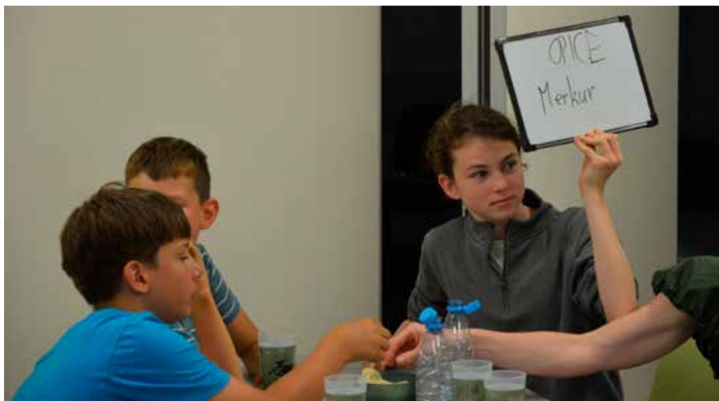
Med kvizom so bili aktivni vsi udeleženci

organizatorjev kot udeležencev. Mlade so navdušili pestrost dogodkov, priložnost za nova poznanstva in sproščeno vzdušje, ki je vladalo vse tri dni. Dogodek je pokazal, kako velik potencial za ustvarjalnost in sodelovanje imajo mladi v Vojniku, kar napoveduje še več podobnih priložnosti v prihodnosti.