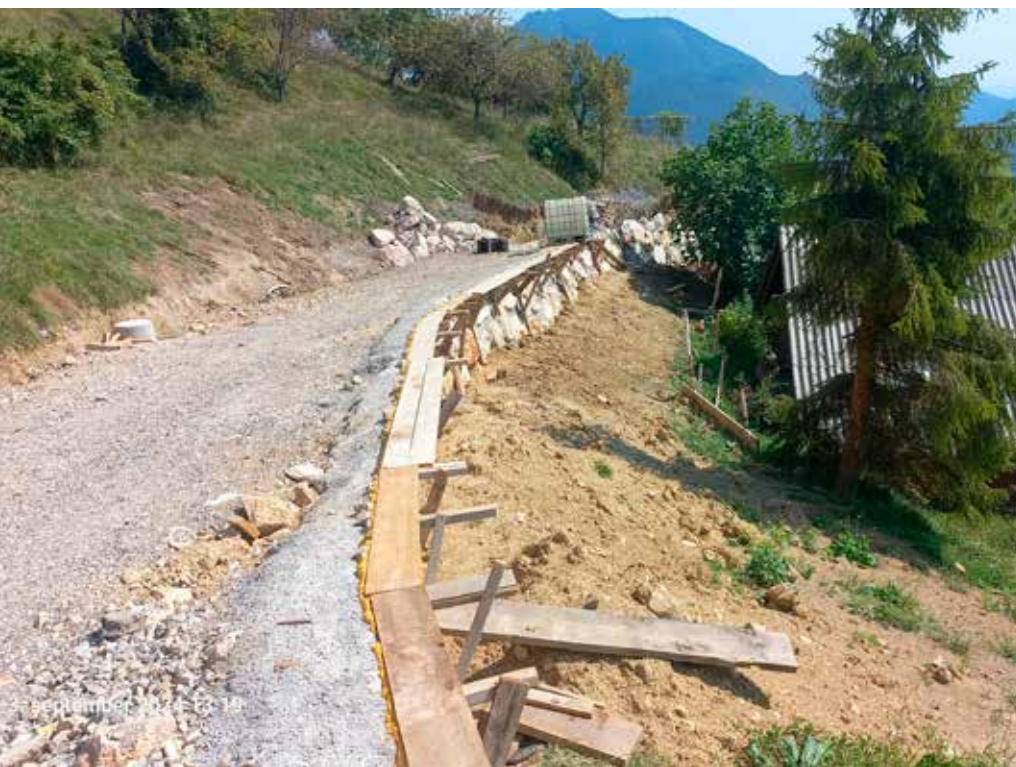
Plaz pod domačijo Gaber na relaciji Pinter – Čretnik

število plazov in tudi lani je bilo tako. V zaključni fazi je sanacija večjega plazu na relaciji Pinter – Čretnik, pod domačijo Gaber. Dela so končana na plazu Založnik v Spodnjem Lindeku. Začela se je sanacija plazu pri Šlaus v Dolu pod Gojko. Evidentiranih je še večje število plazov, ki jih bomo sanirali v prihodnje.