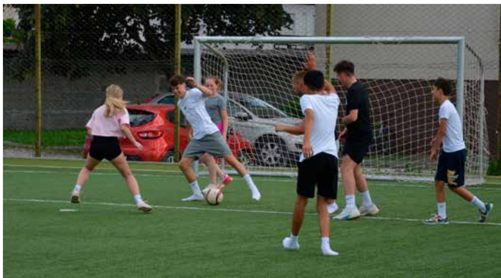
Gibanje in zabava