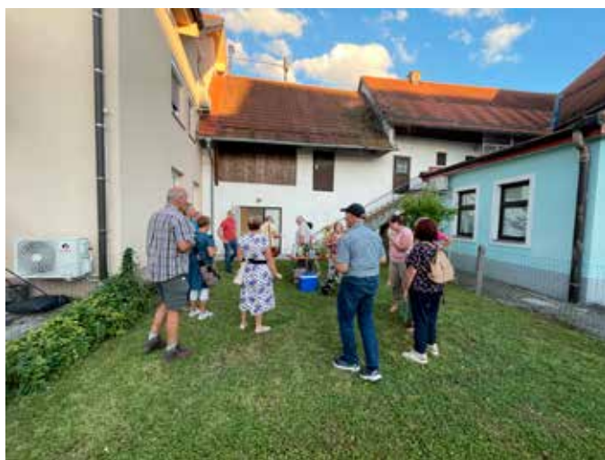
Druženje obiskovalcev po prireditvi

Vsem obiskovalcem se zahvaljujemo za udeležbo in se veselimo vašega obiska na prihodnjih dogodkih v našem kulturnem središču.