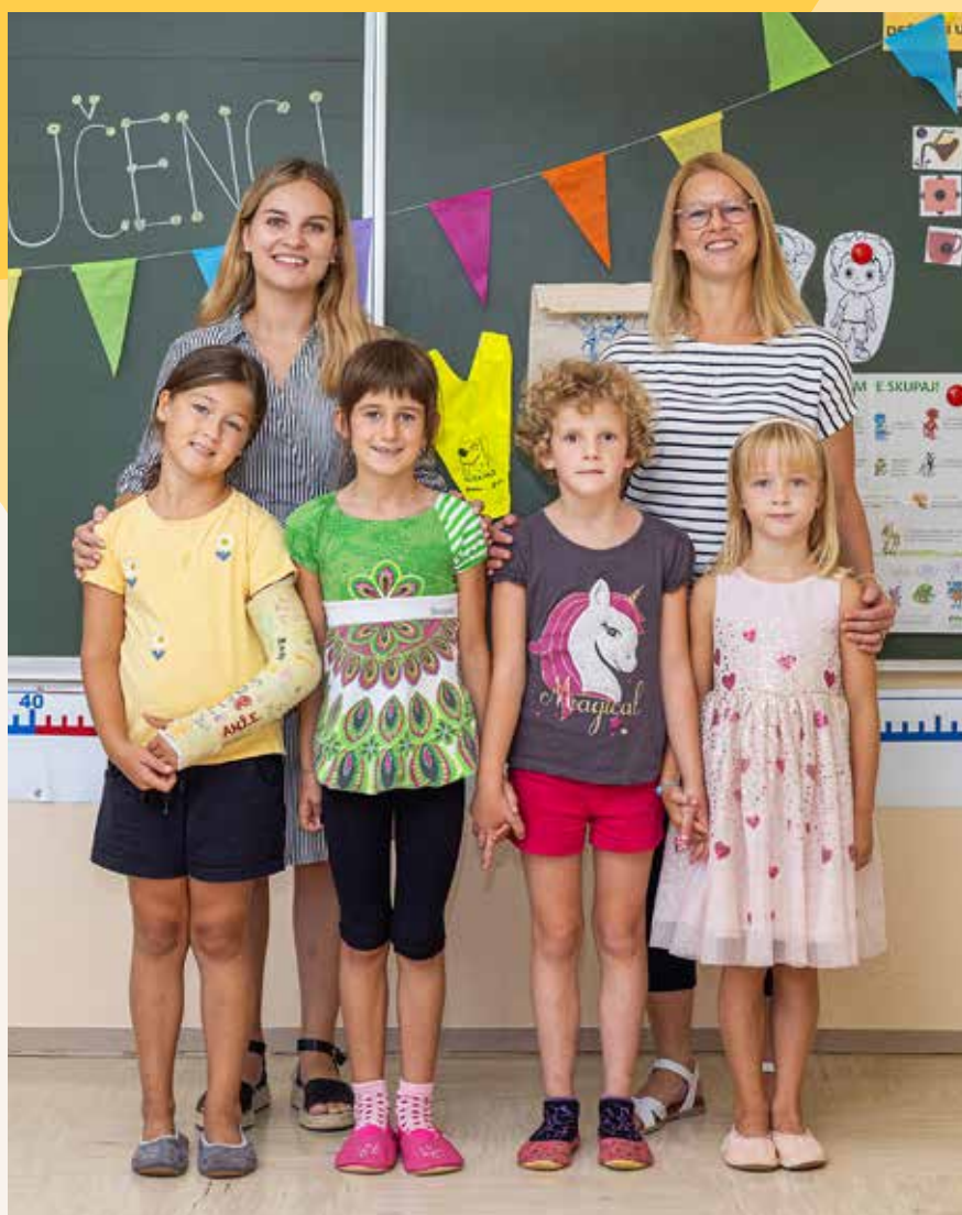
Osnovna šola Vojnik, Podružnična osnovna šola Socka, 1. razred