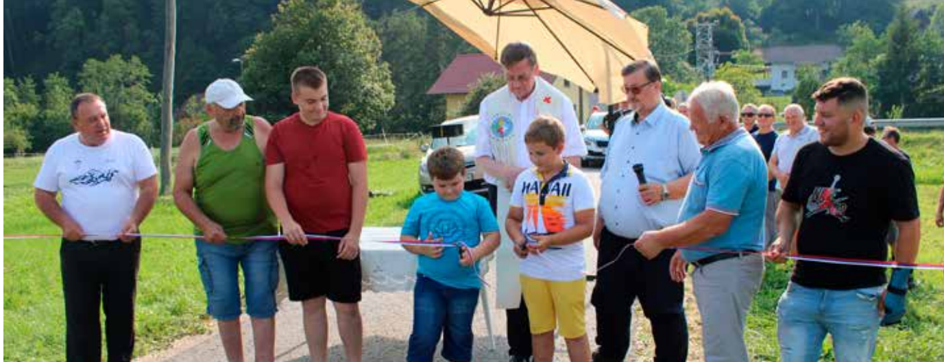
Slavnostno odprtje ceste v Socki (proti Straži) 19. julija 2024