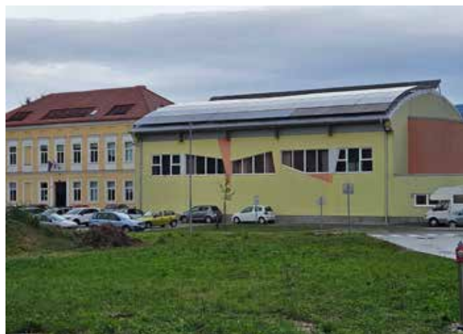
Na strehi telovadnice so opravili vsa potrebna dela.

Zahvaljujemo se vsem občanom za razumevanje in podporo med izvajanjem del ter se veselimo uspešno zaključenega projekta.