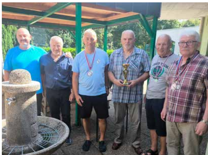
Tekmovalci Strelskega društva bratov Dobrotinškov Vojnik med podelitvijo pokala Občine Žalec.