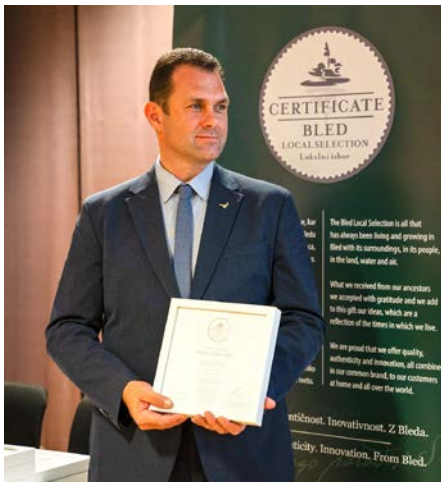
Podeljeni so bili novi certifikati za Blejski lokalni izbor.