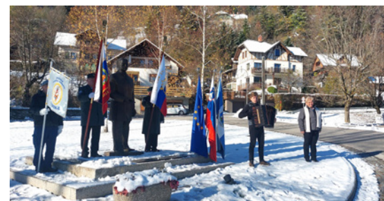
Slovesnost na Bledu