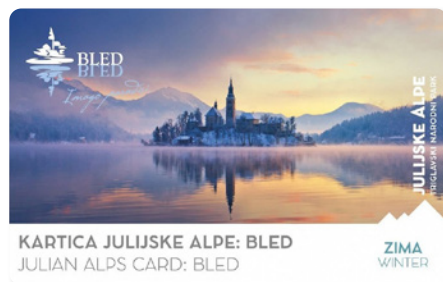
Kartica gosta Julijske Alpe: Bled – Zima