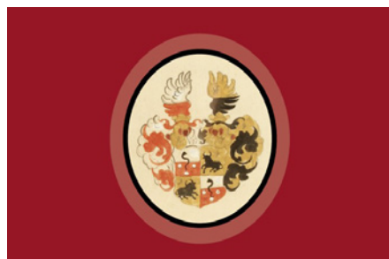
Grb rodbine Khisl

Grad Khislstein je v svojih zapisih že v 17. stoletju omenjal Janez Vajkard Valvasor. Zgodovina kranjskega gradu pa je še starejša od Valvasorjevih zapisov in sega v 12. stoletje, ko je domnevno na robu savske terase stala utrdba, kjer je bival deželni grof za Kranjsko. Tu sta v sredini 13. stoletja ortenburška grofa Henrik in