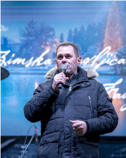
S prižigom lučk in županovim nagovorom je Zimska pravljica odprla svoja vrata.