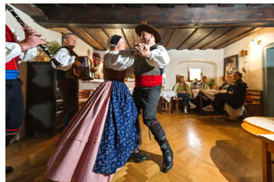
V Sodarjevi domačiji v Bodeščah boste zaplesali.

Petzvezdično doživetje popelje v praznični čas prve polovice 19. stoletja, v čas velikega slovenskega pesnika Franceta Prešerna. Bogato tradicijo Bleda z okolico udeleženci začnejo spoznavati v vasi