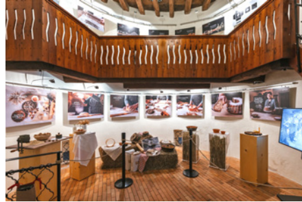
Razstava Zgodba o slovenski potici v Galeriji Stolp na Blejskem gradu.