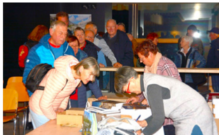
Za novi zbornik je veliko zanimanja