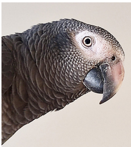
Mali sivi žakec

Že kar nekaj let zavrženim in odvečnim eksotičnim hišnim ljubljencem skušam nuditi drugi dom in oskrbo, prav tako izobražujem in ozaveščam ljudi, ki si tovrstne hišne ljubljence zaželijo. Na Bledu v obliki razstave eksotičnih živali in posebnih delavnic, kjer je te živali možno tudi pobožati, širimo navdušenje nad eksotičnimi hišnimi ljubljenci. Naša ustanova je kombinacija zavetišča, ZOO-ja in muzeja.