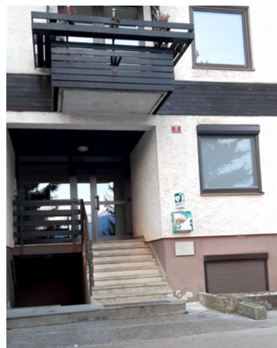
Nov AED na Alpski cesti 13

Društvu se za podeljena sredstva zahvalujemo, obveščamo pa, da lahko del dohodnine namenite omejenemu društvu, ki bo s podobnimi akcijami nadeljeval tudi v prihodnje.