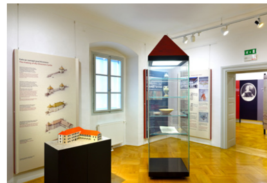
Razstava o gradu Khislstein