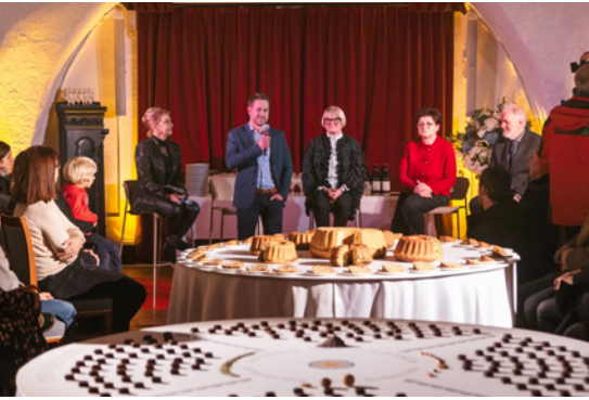
Z odprtja razstave v Viteški dvorani na Blejskem gradu.

nili bogati predstavitvi projekta v povsem napolnjeni Viteški dvorani.