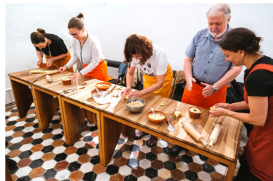
Priprava in peka potice

Prijave: do 12. ure na dan pred razpisanim terminom doživetja