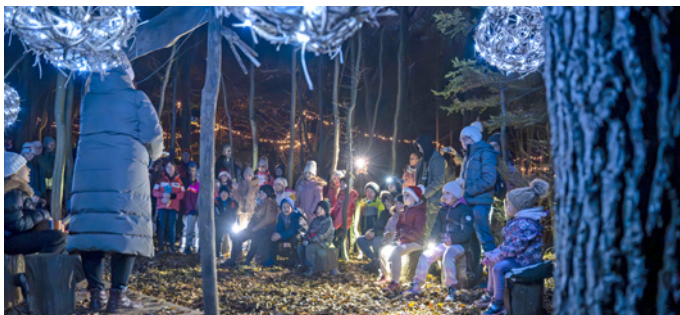
Božiček na Homu

:: Turistično društvo Zasip in KUD KAMOT Zasip