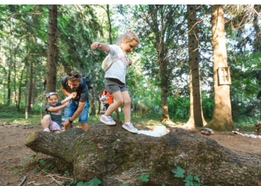
Skozi začarani gozd

Na poučno raziskovanje ljudskih pravljič, zgodovine in lokalnega značaja vabi vodeno doživetje Začaran gozd, ki se vije na razglednem hribu Hom s čudovitim pogledom na Bled in okolico. Otroci skozi reševanje nalog in ugank spoznavajo lokalne ljudske pravljice in legende, kulturno dediščino in zgodovino kraja, hkrati pa opazujejo in občutijo naravo. V vilinski kuhinji se lahko posladkajo z zdravim posladkom z Vrta okusov, odrasle pa čaka degustacija lokalnih dobrot. Na zadnji postaji jih čaka še nekaj »skratje telovadbe« in rešitev uganke, ki jo skušajo razvozlati na poti skozi Začaran gozd.