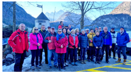
Zbirno mesto na Dovjem, foto: Jožica Mihelčič