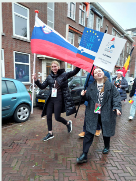
Parada po Haagu, foto: Boža Grafenauer