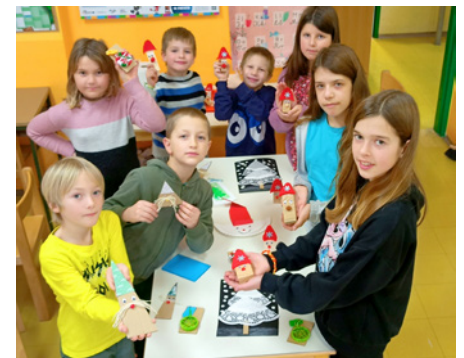
Praznični december v šoli na Bohinjski Beli

:: Urša Beber, Podružnica Bohinjska Bela