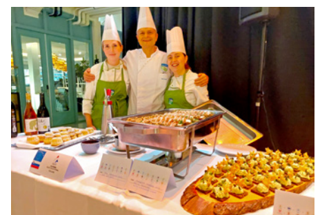
Evropski bife