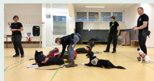
Otroke v vrtcu Bled obiskali pasji reševalci