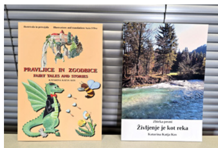
Novi knjigi KUD Zasip