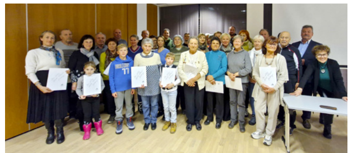
Dobitniki priznanj s člani komisije.