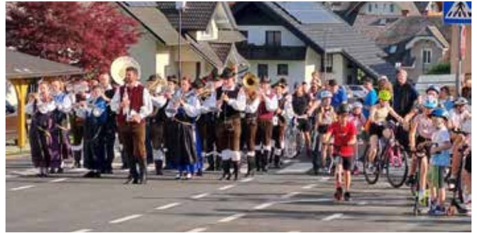
slovesno odprtje, 17. junij 2024