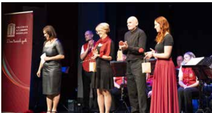
Zaključek 14. sezone TVKS

sodelujete v žrebanju za super nagrade. Za vse, stare od 13 do 16 let, pa imamo projekt Najpoletavci. Akcija prav tako poteka od 10. junija do 10. septembra. Skupaj s svojimi podatki oddate na-