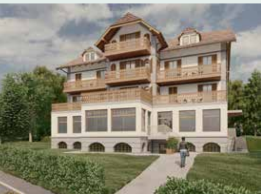
Končni izgled stare Vovkove vile po končani rekonstrukciji

Po drugi svetovni vojni je bil penzion podržavljen, z njim je upravljal sindikat PTT Jugoslavije, kasneje PTT Slovenije. Leta 1983 ga je odkupil Sekretariat za narodno obrambo SFRJ in ga skupaj s hotelom Svoboda (današnji hotel Astoria) odprl kot restavracijo, v spodnjih prostorih je bila urejena vinska klet, nato pa pivnica, ki je obratovala vse do zaprtja. Zgradba je vso svojo zgodovino služila za počitniške in turistične potrebe.