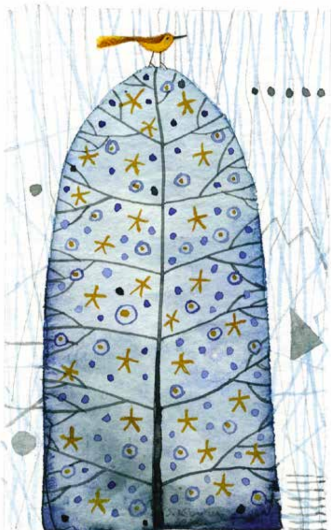
Ilustracija Silva Karim

Četrtek, 19. december 2024 • številka: 270 • 10.000 izvodov • e-pošta: info.latnik@gmail.com • www.mojaobcina.si/ajdovscina/org/latnik.html