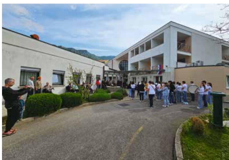
1. maja je potekala še zadnja budnica DSO

...). Oskrbni center bo stičišče pomoči starejšim, ki bivajo doma v mestu in okoliških vaseh, vendar ne potrebujejo še storitve pomoči na domu, pač pa zgolj posamezne podporne storitve po vzoru storitev socialnega servisa. Načrtuje se tudi multimodalni razvojni center za socialne inovacije za aktivno in zdravo starost, ki ga snujemo v sodelovanju z Univerzo v Ljubljani. V delu stavbe se načrtuje tudi ureditev prostorov, namenjenih socialnim storitvam za bivalno enoto VDC Ajdovščina-Vipava – predvidena je vzpostavitev bivalne enote in prostorov za dnevno varstvo uporabnikov VDC. Prostori za dnevno varstvo bodo na voljo tudi za osebe s posebnimi potrebami, zlasti tiste z motnjo v duševnem razvoju – zanje so predvideni prostori za začasno namestitev.