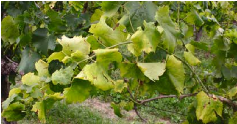
Simptomi ukužbe z zlato trsno rumenico na sorti malvazija

Zlata trsna rumenica ( Flavescence doree ) je navarna bolezen, ki v vinogradih lahko povzroča velike težave. Trenutno imajo z obolenjem največ težav na Štajerskem, vendar zlata trsna rumenica predstavlja grožnjo tudi na Primorskem. V dvanajstih letih se je tudi v Vipavski dolini dodobra razširila in le vestnim vinogradnikom, ki spoštujejo predpise o obveznem zatiranju prenašalca gre zahvala, da razmere niso hujše.